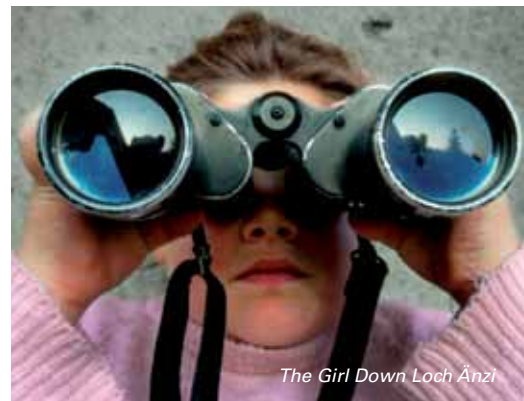
The Girl Down Loch Änzi