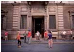
Le Ultimo Cose