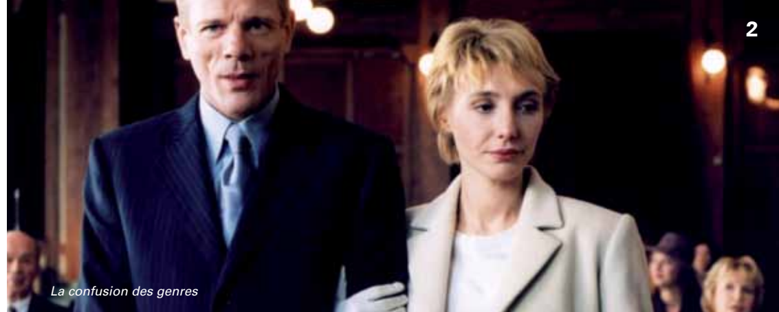
La confusion des genres