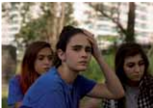
Mate-me por favor