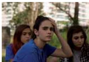
Mate-me por favor