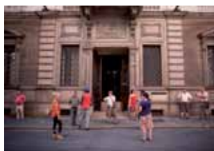
Le Ultimo Cose