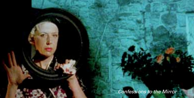
Confessions to the Mirror

La section parallèle dresse chaque année un panorama autour d'un thème cher aux engagements du Festival : après l'Environnement (Turbulences) en 2015 et la Musique (Itinérances Musicales) en 2016, le Festival consacre cette section 2017 à la photographie : Liberté(s) de voir. La photographie, présente dans les films de la section, se révèle comme trace ou absence, comme filtre pour questionner l'autre. Un tirage à double exposition où la réalisatrice, souvent photographe, pose aussi la question de celle qui regarde.