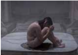
À mon âge je me cache encore pour fumer

Présentation du numéro « Féminismes dans les pays arabes » : les luttes des femmes arabes contre le patriarcat, les pouvoirs tyranniques, l'islamisme, le colonialisme et le néo-colonialisme.