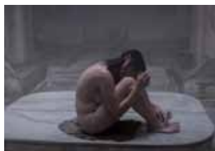
À mon âge je me cache encore pour fumer

Présentation du numéro « Féminismes dans les pays arabes » : les luttes des femmes arabes contre le patriarcat, les pouvoirs tyranniques, l'islamisme, le colonialisme et le néo-colonialisme.