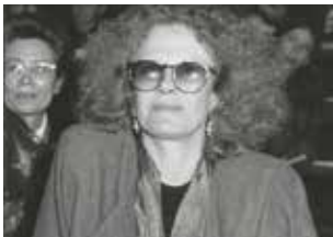
Sois belle et tais-toi

En présence de la réalisatrice et de Fanny Ardant (sous réserve)