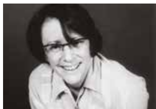
Chroniques d'un Festival