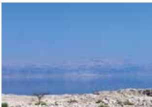
Un long été brûlant en Palestine

En présence de la réalisatrice et de l'équipe du film