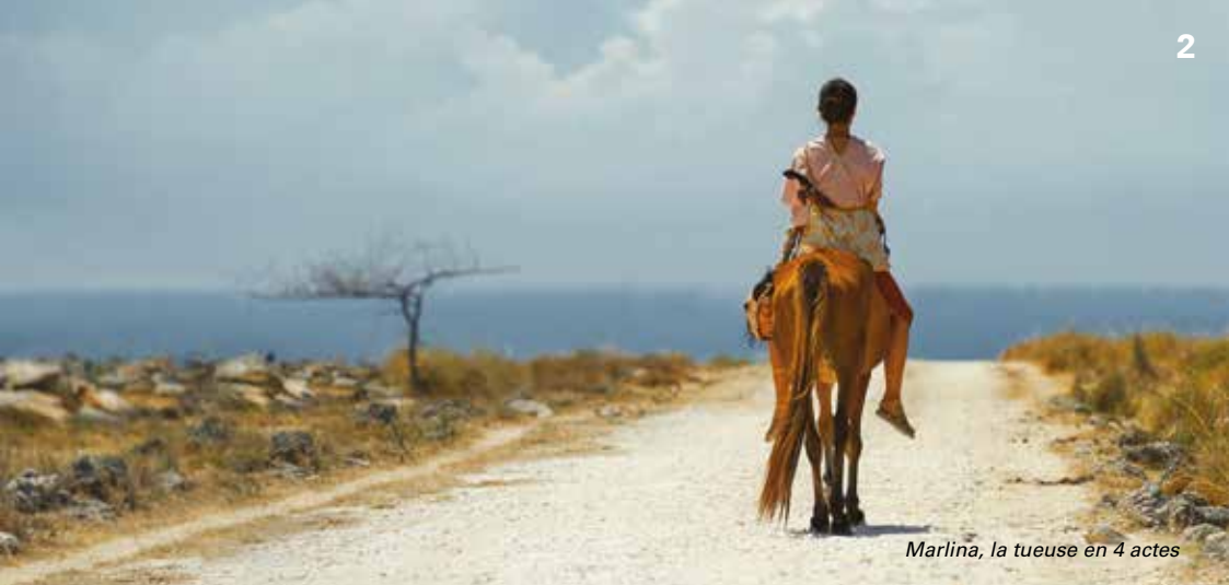
Marlina, la tueuse en 4 actes