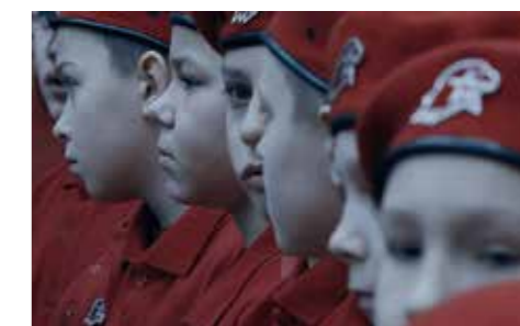
IMMORTAL de Ksenia Okhapkina (Estonie)