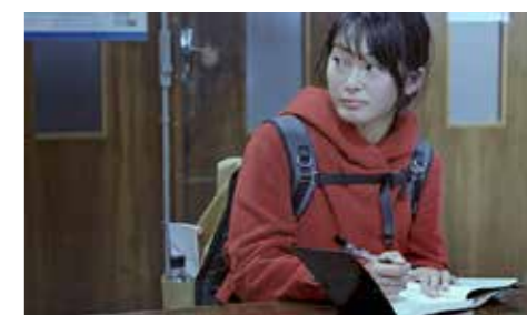
L'ILE DES PERDUS de Laura Lamanda (France)