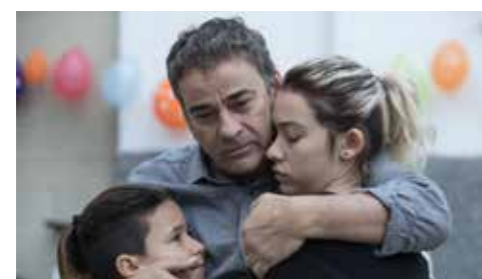
A THIEF'S DAUGHTER (La hija de un ladrón) de Belén Funes ((Espagne)