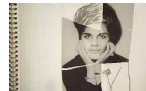
RADIOGRAPHIE D'UNE FAMILLE de Firouzeh Khosrovani (Norvège/Iran/Suisse)