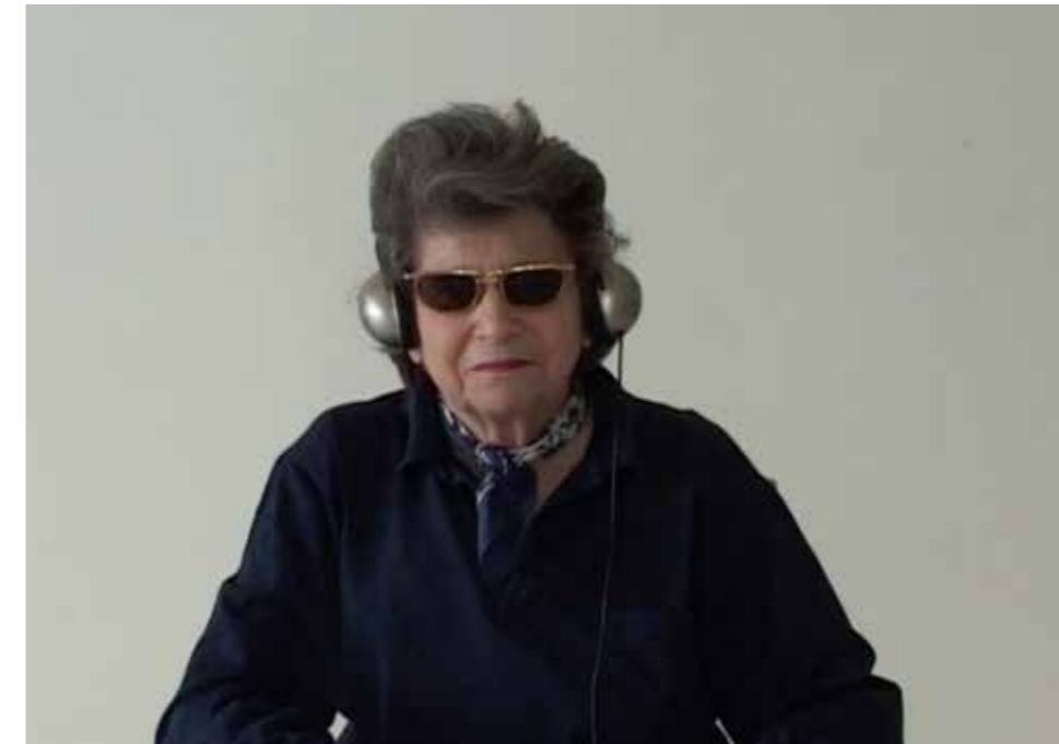
@ Hélène Delprat

Fidèle à sa renommée d'investigation et d'exploration de l'histoire du cinéma des réalisatrices, le Festival vous invite à la découverte de l'œuvre et de la vie d'une femme engagée dans son temps : NICOLE STÉPHANE, actrice, réalisatrice et productrice.