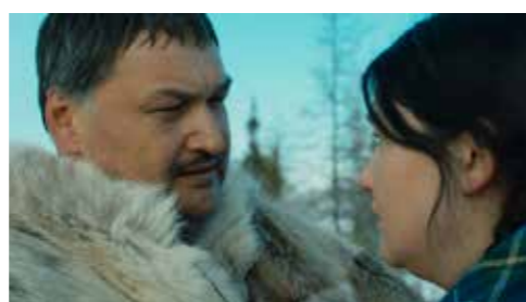
LA RIVIÈRE SANS REPOS de Marie-Hélène Cousineau et Madeline Ivalu (Canada)