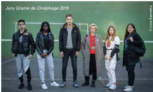
Jury Graine de Cinéphage 2019

Initié en 1985, le jury Graine de Cinéphage se compose d'élèves des lycées Léon Blum (Créteil) et Guillaume Budé (Limeil-Bréavannes) qui remettent le prix Graine de Cinéphage parmi 4 films de la sélection :