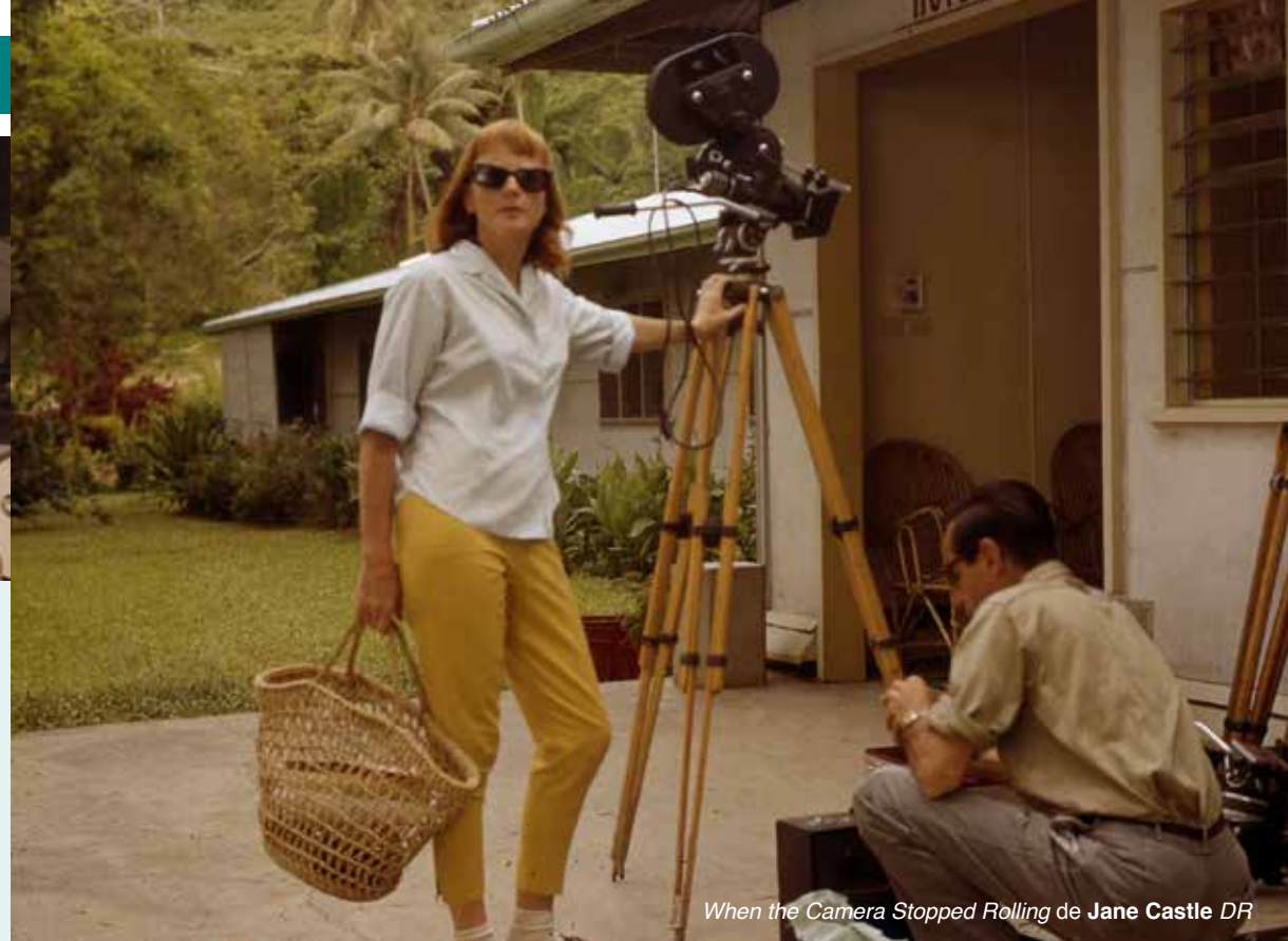
When the Camera Stopped Rolling de Jane Castle

www.filmsdefemmes.com Festivalscope > du mar 6 au sam 10 avril